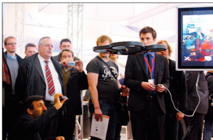
L'AR.Drone a été présenté au CeBIT 2010 et à l'exposition célébrant 200 ans d'histoire du corps des Mines.

L'incroyable stabilité de cet appareil, sa maniabilité et sa technologie de navigation/positionnement ont tiré pleinement profit de cette rencontre.