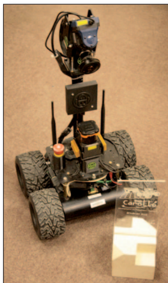
CoreBot vainqueur du défi CAROTTE.

à de nombreux contrats européens. Ces actions sont complétées par des collaborations directes et suivies avec certains partenaires industriels tels que : VALEO, PSA, SAGEM, MENSI (PME française spécialisée dans les systèmes de numérisation 3D).