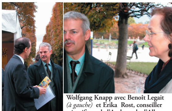
Science en fête 2004.

Initiée en 1996, la coopération laser a d'abord œuvré pendant 7 ans avec le GIP GERAILP (Groupement d'étude et de recherche pour les applications industrielles des lasers de puissance) à Arcueil. Aujourd'hui, elle prend un nouvel essor grâce à Armines et au Centre des matériaux d'Évry.